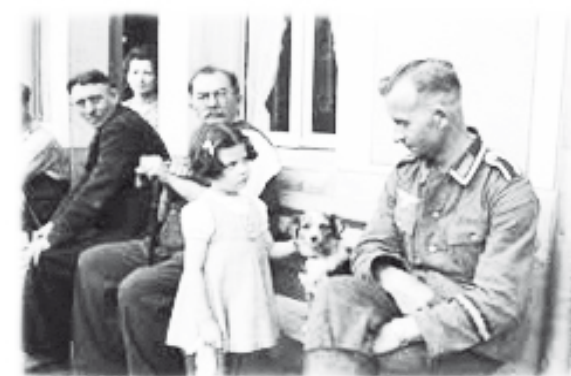
Немцы налаживают отношение с гражданскими на «освобожденных» территориях

что удалось «освободителям» – полностью и навсегда уничтожить целую страну, разрушить народ. А затем заставить весь мир поверить, что Ирак в принципе страна созданная искусственно. И народы, его населяющие, вместе жить не смогут. Только если под диктатурой.