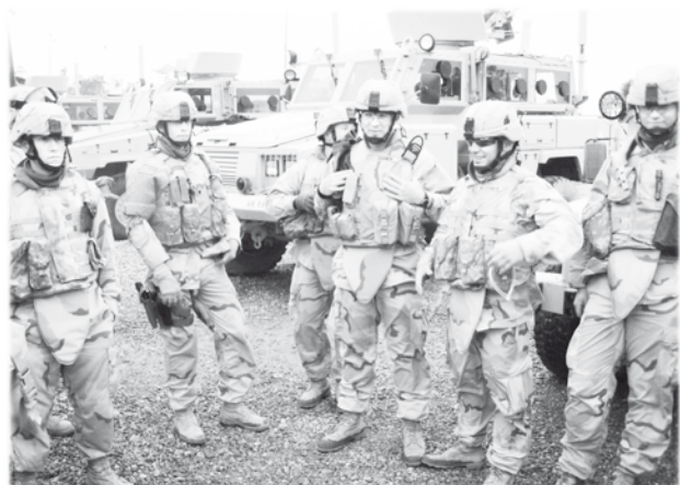
Американские солдаты - победоносные, сытые, довольные.

Начнем с первого. Мы в Ираке имеем типичный пример страны, находящейся под оккупацией, примерно тоже самое ждало бы нас при