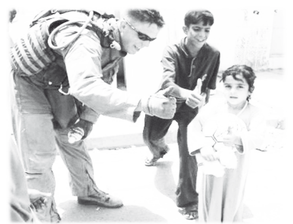
Американцы налаживают отношение с гражданскими на «освобожденных» территориях

Взрывают суннитов и говорят, что это сделали шииты. Или взрывают шиитов и обвиняют